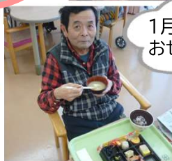
1月1日の昼食はおせちでした！