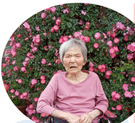
勝央苑玄関のバラの前で！