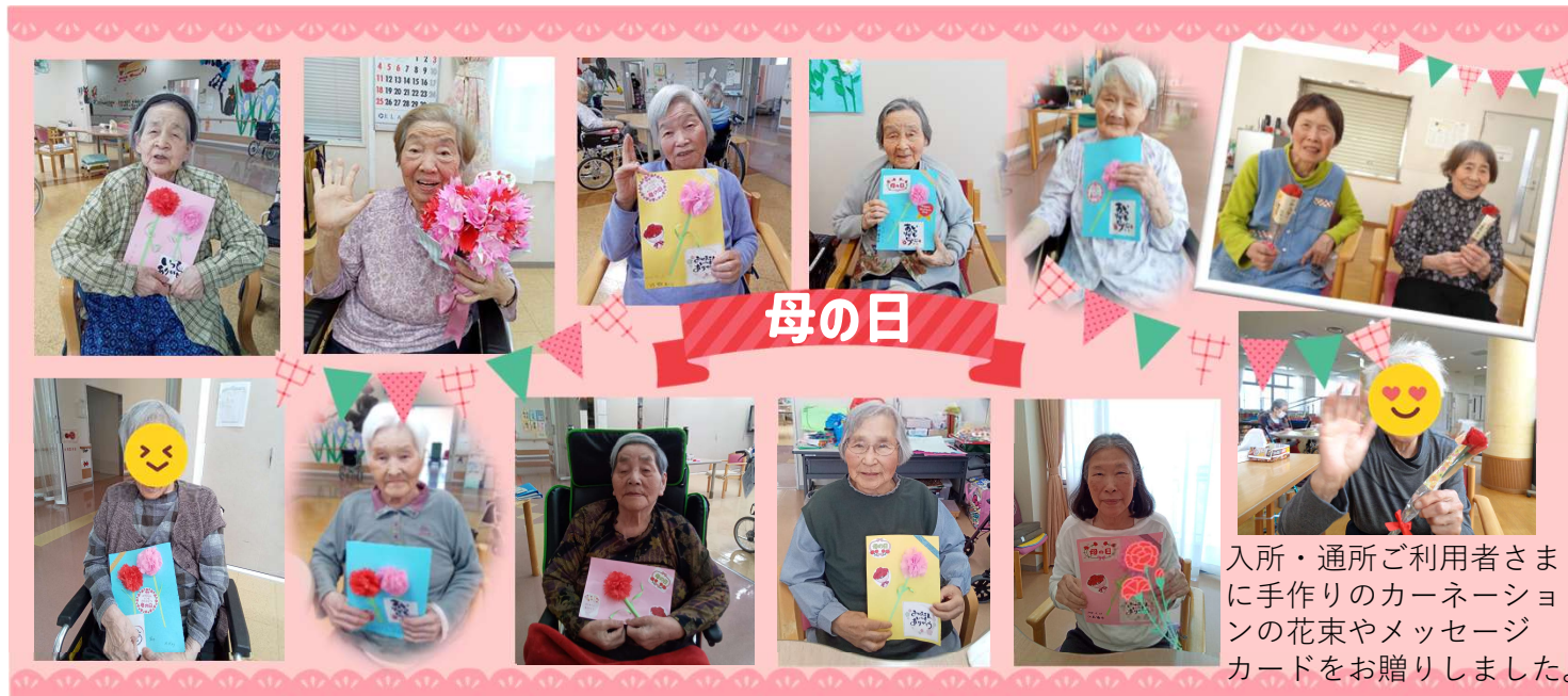
入所・通所ご利用者さまに手作りのカーネーションの花束やメッセージカードをお贈りしました。